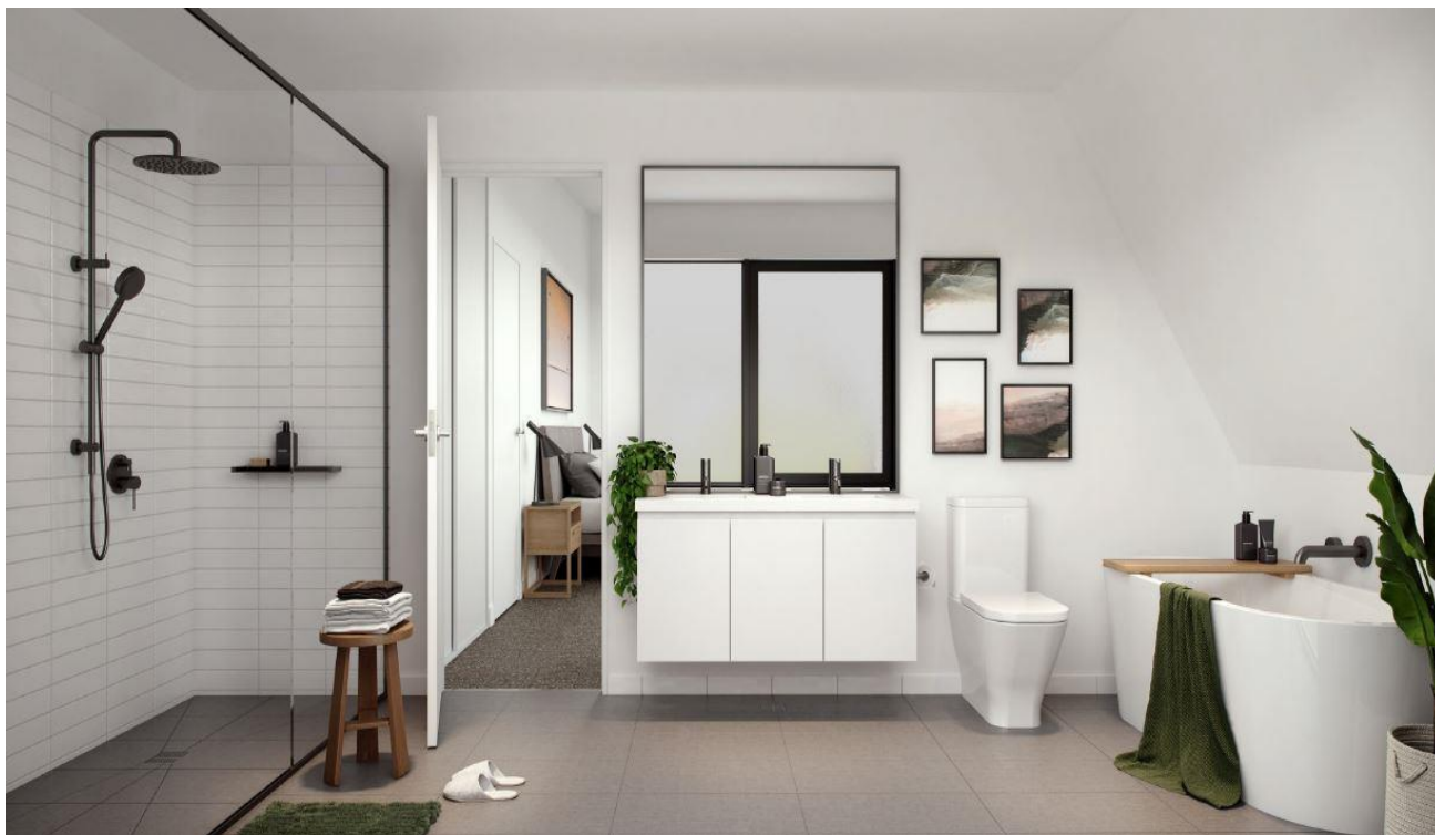
1、户型: Townhouse 1, 3室 2卫+ powder+laundry, 2车位, 面积 185.1 平方米, 价格: $845,000。